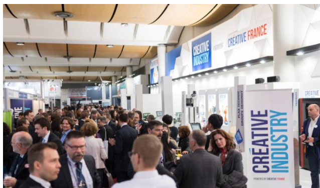
Cocktail de networking organisé lors de la journée franco-allemande - édition 2016