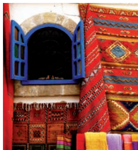
Maroc p. 3