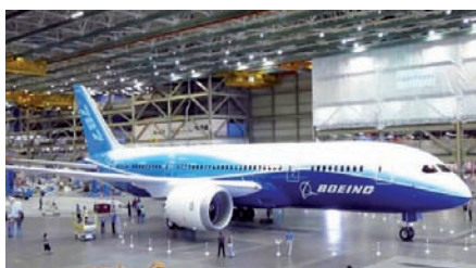
Radiall, fournisseur de Boeing.