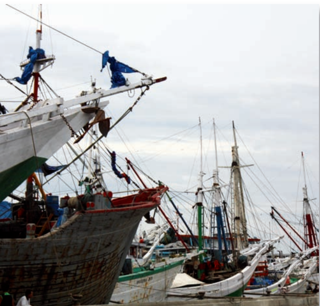
Le port de Jakarta.

L'Indonésie est considérée aujourd'hui comme l'une des grandes puissances économiques émergentes. Son statut de membre du G20 et sa stabilité politique retrouvée en font l'un des partenaires principaux d'Asie.