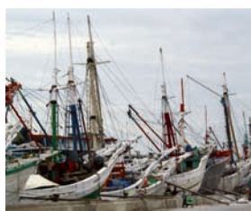
Indonésie p. 2