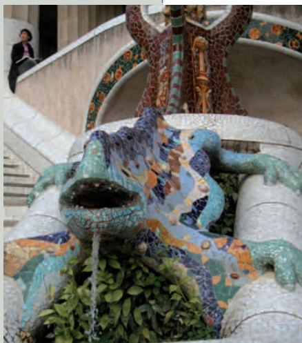
Salamandre - Parc Guell à Barcelone.