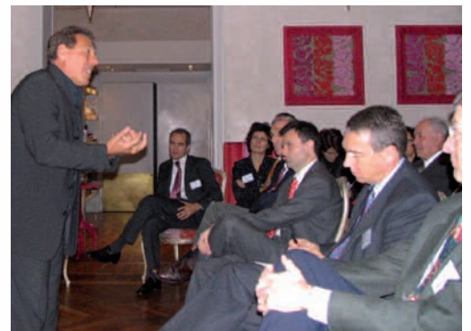
Soirée des adhérents Grex - janvier 2007.

Les exportations ont franchi un record absolu jamais atteint avec une hausse de 12,1 % par rapport à 2005 et les importations ont, elles aussi, progressé de 12,4 %.