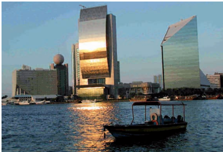
Emirats Arabes Unis.

Pour 2007, le Portugal devrait voir la croissance de son PIB accélérer légèrement