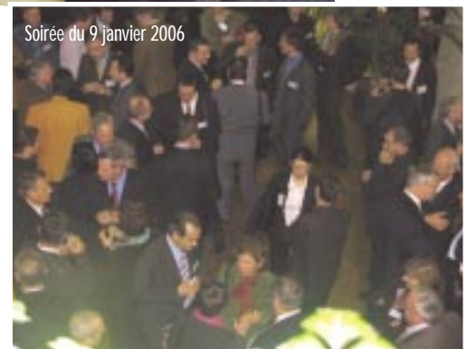
Soirée du 9 janvier 2006