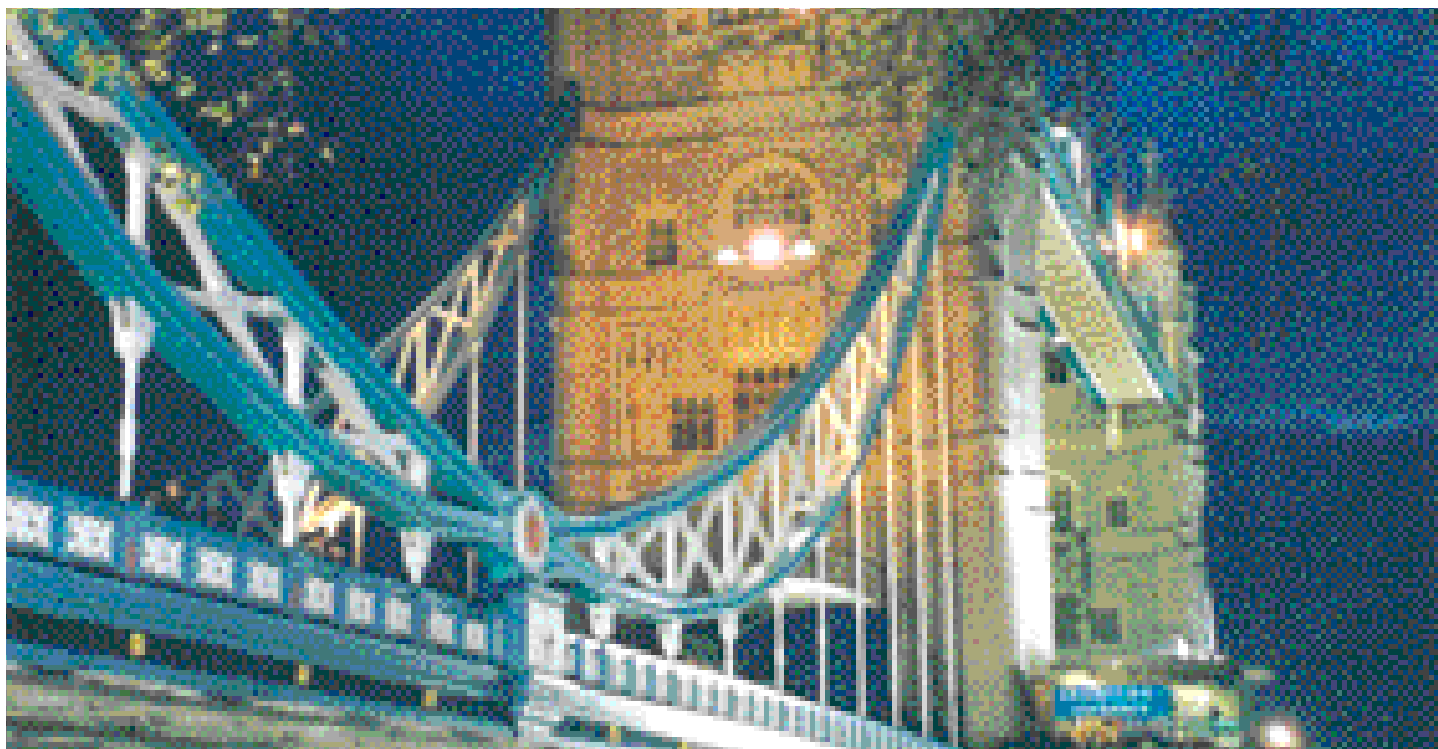
Tower Bridge à Londres.