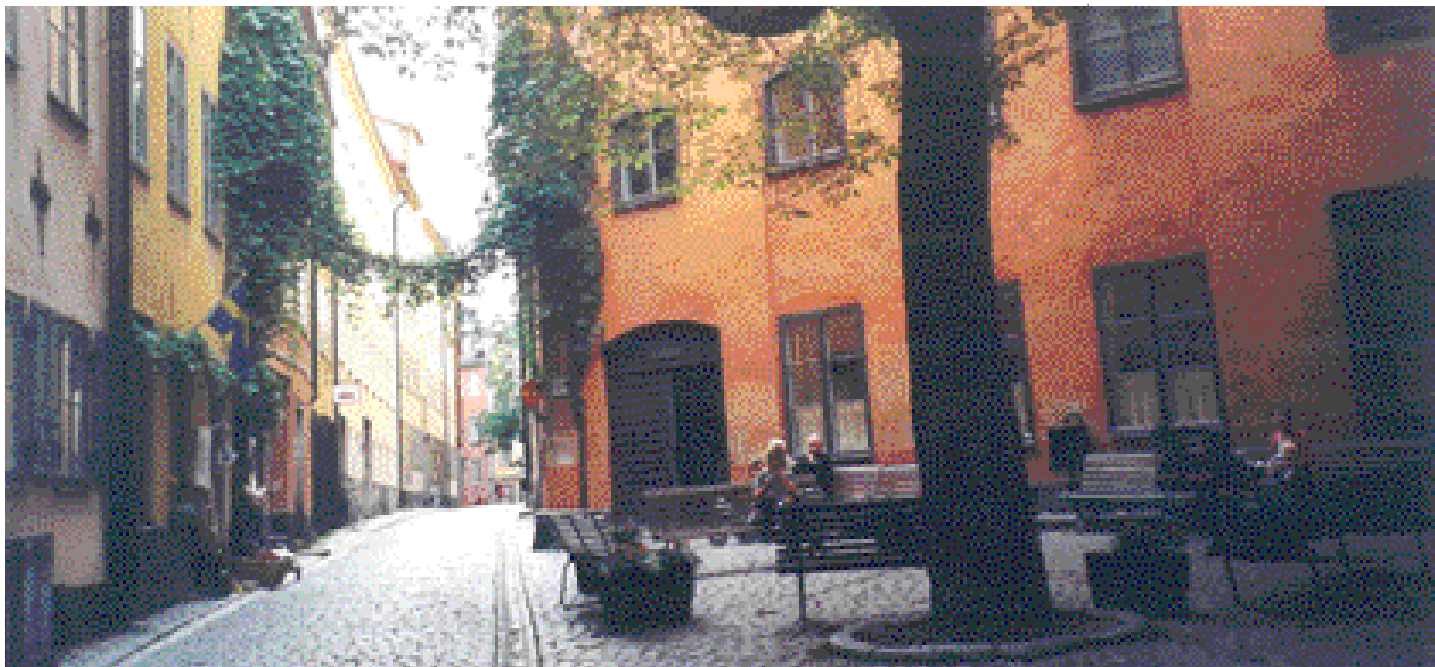
Le quartier Gamla Stan à Stockholm.