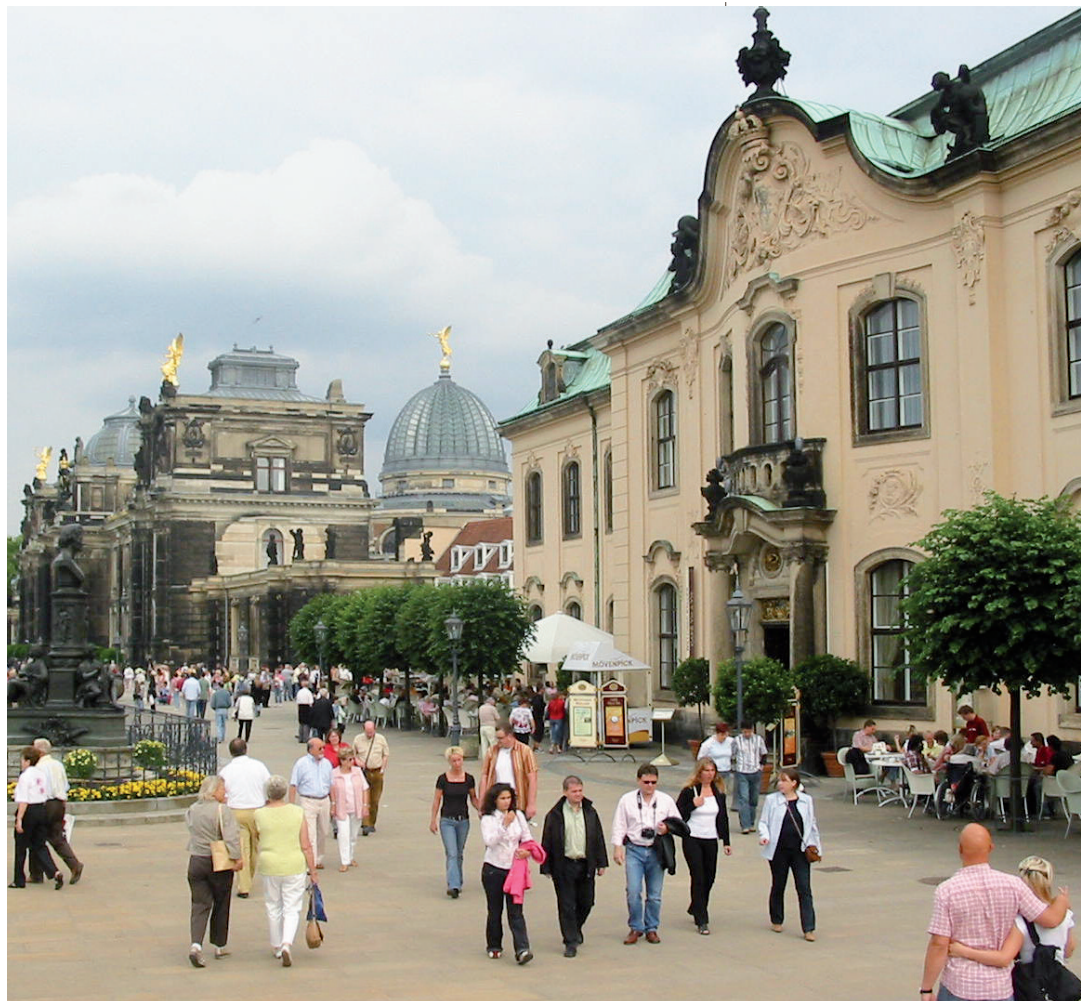
Dresde, le quartier historique.