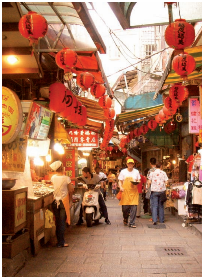
Taiwan, scène de rue.

Les parcs scientifiques : trois parcs scientifiques jouent un rôle majeur dans l'économie de l'île. Créé en 1980 aux abords des universités Tsing Hua et Chia Tung et à proximité de l'ITRI, le parc de Hsinchu est plus particulièrement dédié à la microélectronique, aux TIC et à l'instrumentation de précision. Il accueille aujourd'hui 416 sociétés employant près de 130 000 salariés. 11 % des brevets taiwanais sont déposés par le parc de Hsinchu.