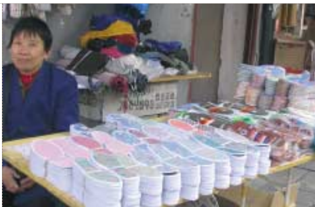
Marché en Chine.

Depuis décembre 2004, la marque des produits importés doit être mentionnée sur la