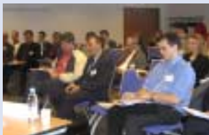
Participants à la réunion des 15 ans du Club Juridique Grex.

Le thème de la conférence "Prévenir, réduire, mieux gérer vos litiges à l'international", animée par des membres et experts du Club, fut l'occasion d'un débat avec les participants que vous retrouverez sur Grex Ecobiz, L'espace des adhérents Grex.