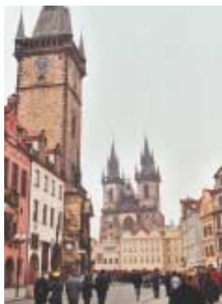
Vieille ville - Prague.

Les représentants de la CCI française en République tchèque ont rencontré en entretien individuel toutes les entreprises intéressées, le lundi 18 avril, au World Trade Center Grenoble.