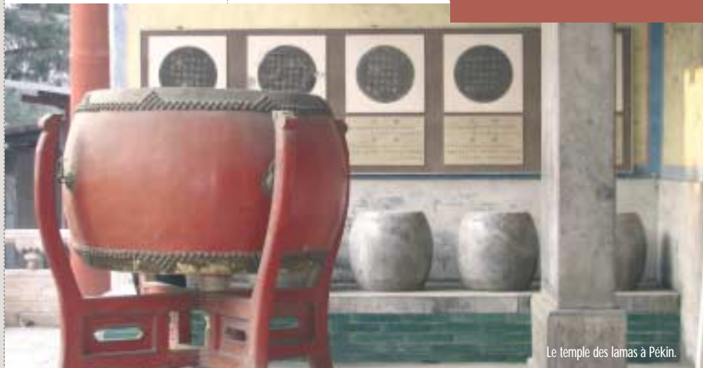
Le temple des lamas à Pékin.

Séminaire approche socio-culturelle "Mieux connaître vos interlocuteurs chinois pour bien négocier". Contact Grex : Anne-Laure Pauty - 04 76 28 29 41