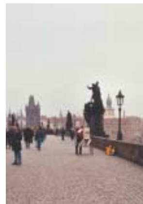
Pont Charles à Prague.