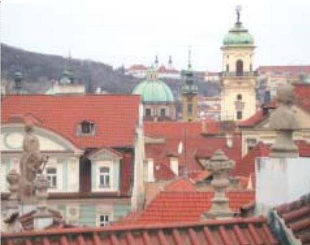
Toits et statues à Prague.

Sont présents en République tchèque les constructeurs Skoda Auto (groupe Volkswagen) et TPCA (Toyota - PSA), en Slovaquie PSA et Kia Motors. L'arrivée des