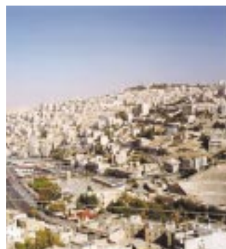
Vue sur Amman.

La Mission économique d'Amman vient d'actualiser ce rapport pour tenir compte des modifications intervenues depuis deux ans dans la législation douanière et fiscale. La nouvelle version du rapport reprend et complète les informations sur la réglementation douanière et fiscale.