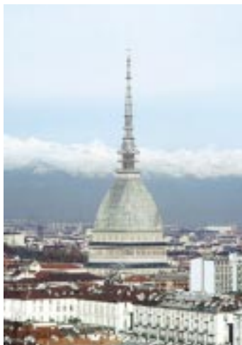
Vue de Turin.