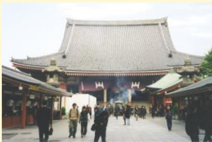
Le temple Asakusa.