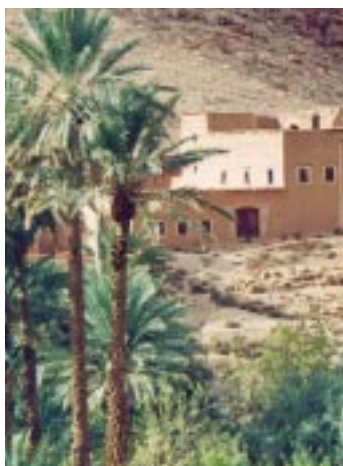
Village au Maroc

Paraphé en janvier dernier par l'Égypte, la Jordanie, le Maroc et la Tunisie, l'Accord d'Agadir devrait constituer une étape décisive, en même temps qu'un processus efficace et viable, sur le chemin de l'intégration régionale parmi les pays de la rive sud de la Méditerranée. Les quatre pays partenaires avaient déjà posé des jalons en faveur de l'intégration en s'associant par le biais de Zone de libre échange (ZLE) bilatérales et en se liant individuellement à l'Union européenne par un Accord d'Association. En paraphant l'Accord d'Agadir, ils se sont entendus pour adhérer au système de cumul paneuropéen, ce qui simplifiera désormais, au sein du nouvel ensemble, la gestion des règles d'origine. La mise en œuvre de l'accord qui prévoit l'élimination totale des barrières tarifaires, sans exclusion de produits (d'ici janvier 2006) devrait conduire à la constitution d'une zone de libre échange entre l'UE et les quatre pays concernés, qui représentent à ce stade un marché de 115 millions d'habitants. (Source : Mission économique de Casablanca - 16 avril 2003)