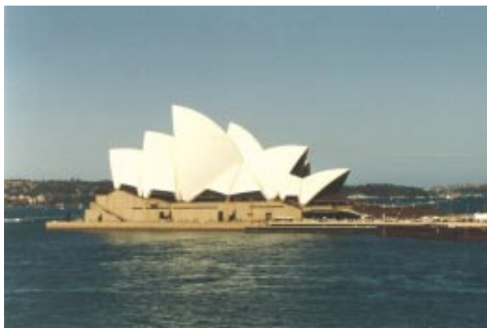
Opéra de Sydney

Le commerce franco-australien a connu une nouvelle année de forte croissance en 2002. Selon les chiffres des douanes françaises, les exportations françaises en Australie ont atteint 1 670 milliards d'euros en 2002, ce qui fait de l'Australie le 32 e client de la France (avant le Mexique, l'Afrique du sud ou l'Arabie saoudite). La progression enregistrée par rapport à 2001 a été de + 21,1 % et s'explique par la livraison de deux Airbus, mais également par d'autres postes, tels