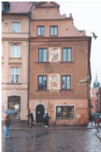
Varsovie - vieille rue.

La production industrielle, en hausse de 3,2 % en octobre, a confirmé les bons résultats enregistrés les mois précédents, d'autant plus que la croissance de cet indice résulte d'une hausse de 4 % de la production manufacturière en variation annuelle, tandis que l'augmentation de la production des secteurs miniers et de l'énergie était plus modeste. Le secteur des équipements électriques a réalisé les meilleures performances sur un an, alors que celui de la construction a connu une baisse de 8,5 % en variation annuelle.