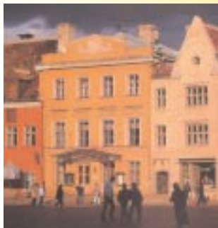
Estonie - place centrale à Tallin.

Fort développement des relations économiques de la France avec l'Estonie et la Lituanie.