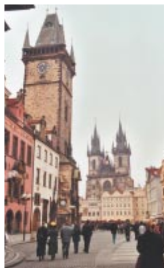
Prague - place de la Vieille Ville.

Depuis janvier 2000, la Czk s'est appréciée en termes réels face à l'euro de 6,4 %, bien davantage que les devises des pays voisins : le zloty polonais s'est apprécié de 5,9 %, le forint hongrois 4,3 % et la couronne slovaque de seulement 1,9 %. Mais si, à court terme, la couronne tchèque peut être sujette à des faiblesses, elle va poursuivre son mouvement d'appréciation à moyen terme. Le déficit de la balance commerciale est et sera compensé par les entrées de capitaux, principa-