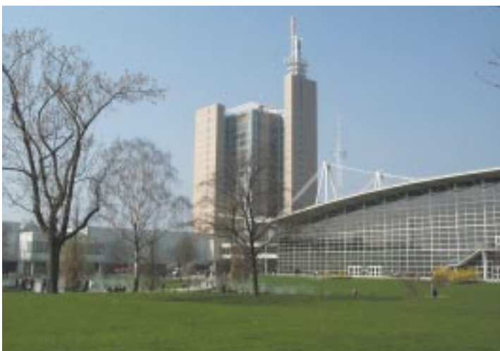
Foire de Hanovre.

La publication des derniers résultats de l'AUMA (la fédération allemande des foires et salons) montre que la morosité de l'économie allemande s'est répercutée sur la branche des foires et salons. L'effondrement du taux de fréquentation des salons sur les nouvelles technologies et les télécommunications en est la principale cause. C'est le cas de Systems à Munich, du Cebit à Hanovre, de Kunststoff. Les salons allemands sont également affectés par l'absence récente de grands noms tels Aol, Nec, Mitsubishi, ou bien encore Unilever et Nestlé. Mais l'AUMA se refuse à tout discours pessimiste et veut croire en une reprise du secteur dès 2003.