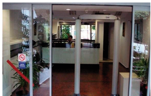
Centre d'affaire CCIF Turquie.

Il est situé dans le quartier de Gayrettepe/Besiktas, proche des axes routiers majeurs de la ville, des ponts sur le Bosphore et des principaux quartiers d'affaires de la ville.